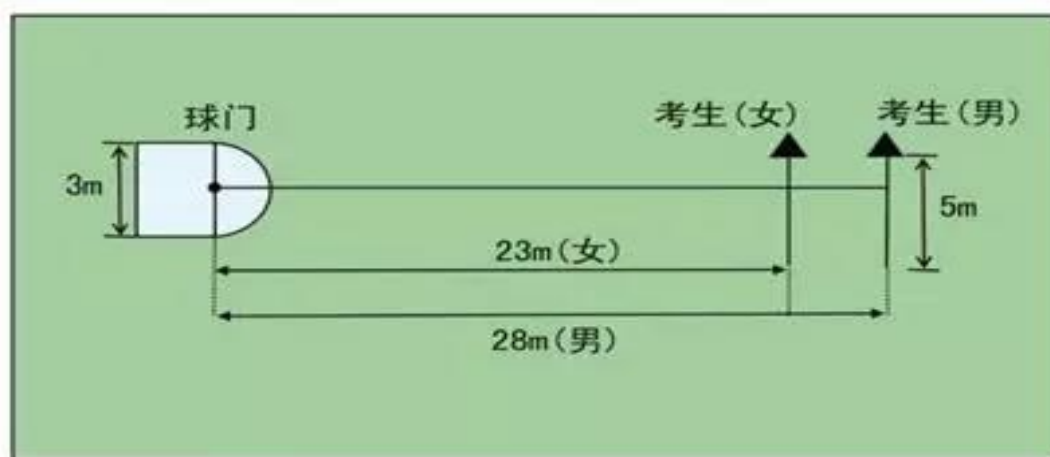
图 2-1 传准场地示意图

① 考试方法 ：如图 2-1 所示，传球目标区域由一个室内五人制足球门（球门净宽度 3 米，净高度 2 米）和以球门线为直径（3 米）画的半圆组成，圆心（球门线中心点）至起点线垂直距离为男子 28 米，女子 23 米。考生须将球置于起点线上或线后（线长 5 米，宽 0.1 米），向目标区域连续传球 5 次，左右脚均可，脚法不限。